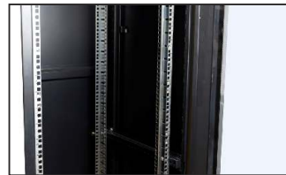
pusta szafa RACK 19"