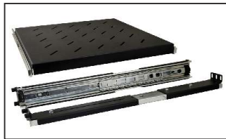
półka z prowadnicami