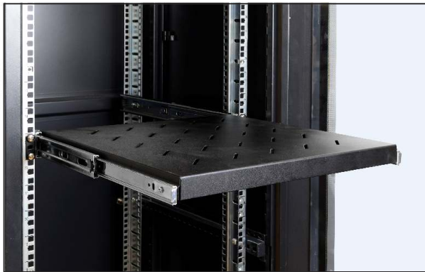
pełny wysuw półki