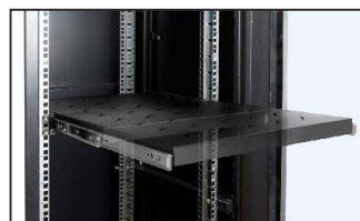
pełny wysuw półki